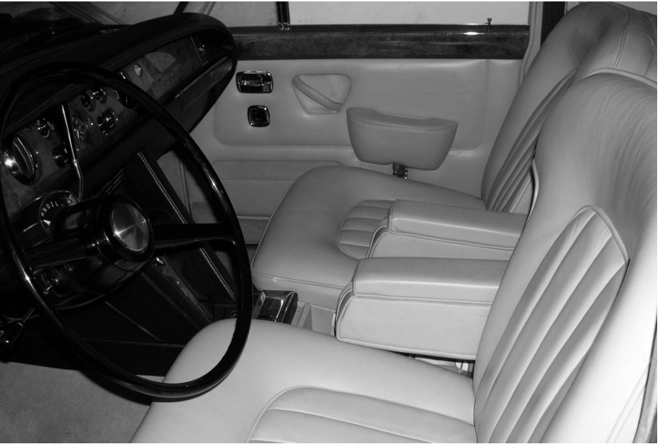
Het eindresultaat: een prachtig interieur mét klaptafeltjes. ■