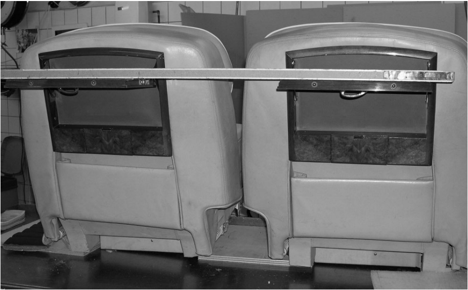
Het uitlijnen van de klaptafeltjes.

moesten beide voorstoelzittingen als- wel de leuningen worden vervangen. Ook de toplaag van beide armsteunen heb ik laten vernieuwen.