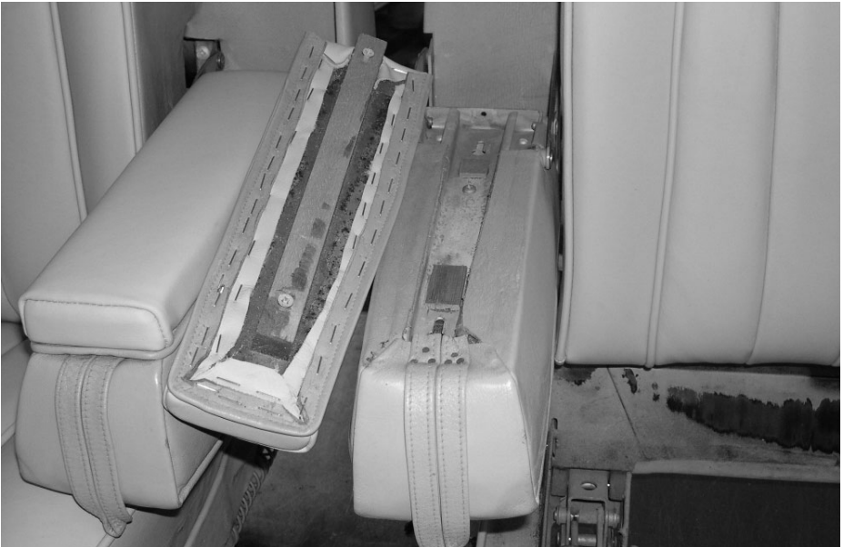
De armsteun bevestiging is hier goed zichtbaar.