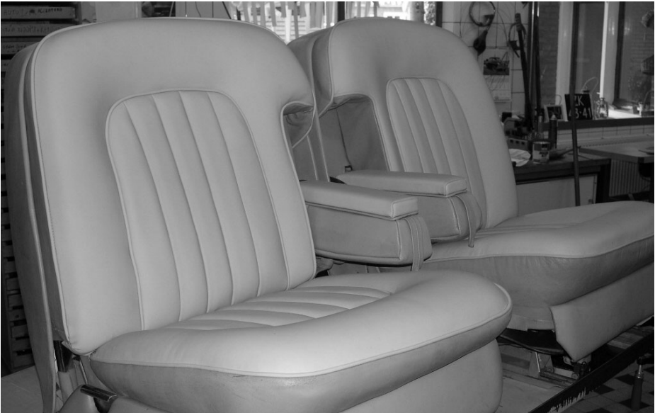
De kleurverschillen zijn nog duidelijk te zien.